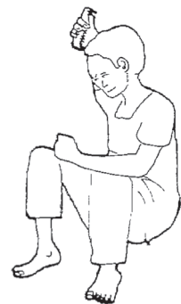
موهایش را شانه کند.