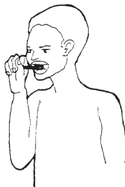
دندان هایش را مسواک بزند.