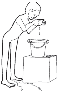
خود را بشوید و حمام کند.

■ فرد به علت بیماری اغلب کثیف و نامرتب است. ممکن است به پاکیزگی اهمیت ندهد. در این صورت مراقبت از خود را به او یاد بدهید. او را تشویق کنید که فعالیت های زیر را همان گونه که پیش از بیماری انجام می داده است، ادامه دهد.